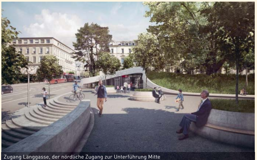
Zugang Länggasse, der nördliche Zugang zur Unterführung Mitte

Jeweils im Sitzungszimmer im Erdgeschoss beim Tiefbauamt Stadt Bern, Bundesgasse 38.