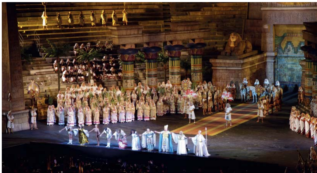
Für Kulturgebeisterte ist ein Opernbesuch in der Arena die Verona ein Muss.

Der ACS beider Basel organisiert Ihnen die Tickets im Voraus und reserviert Ihnen auch ein Hotel vor Ort.