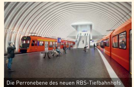
Die Perronebene des neuen RBS-Tiefbahnhofs