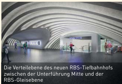
Die Verteilebene des neuen RBS-Tiefbahnhofs zwischen der Unterführung Mitte und der RBS-Gleisebene