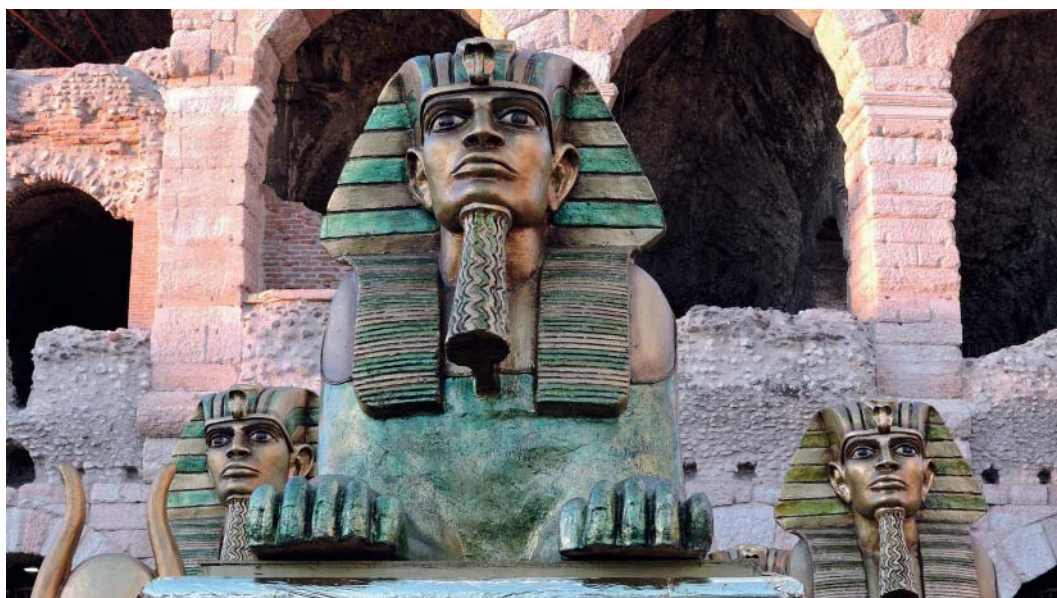
Die Sphinx: Hüterin der Arena di Verona, dem drittgrössten erhaltenen antiken Amphitheater