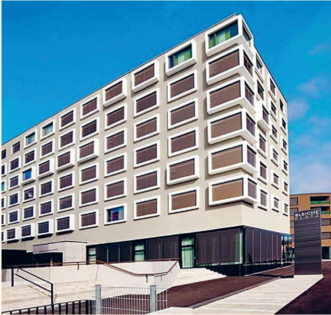
VIENNA HOUSE, AUSTRAGUNGSGORT DER 103. GENERALVERSAMMLUNG 2024