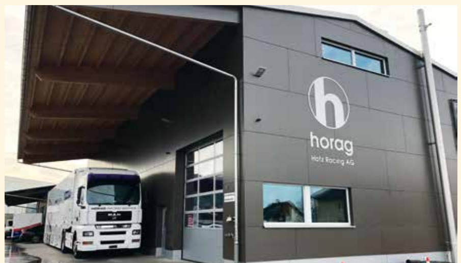
Die Horag Hotz Racing AG in Sulgen (TG).

■ Text Christian Eichenberger, Kommunikationsverantwortlicher bei Auto Sport Schweiz