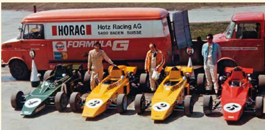
Horag-Teampräsentation 1973 in Lignières mit den Formel Super V.